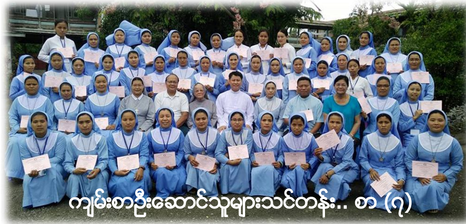
ကျမ်းစာဦးဆောင်သူများသင်တန်း.. စာ (၇)