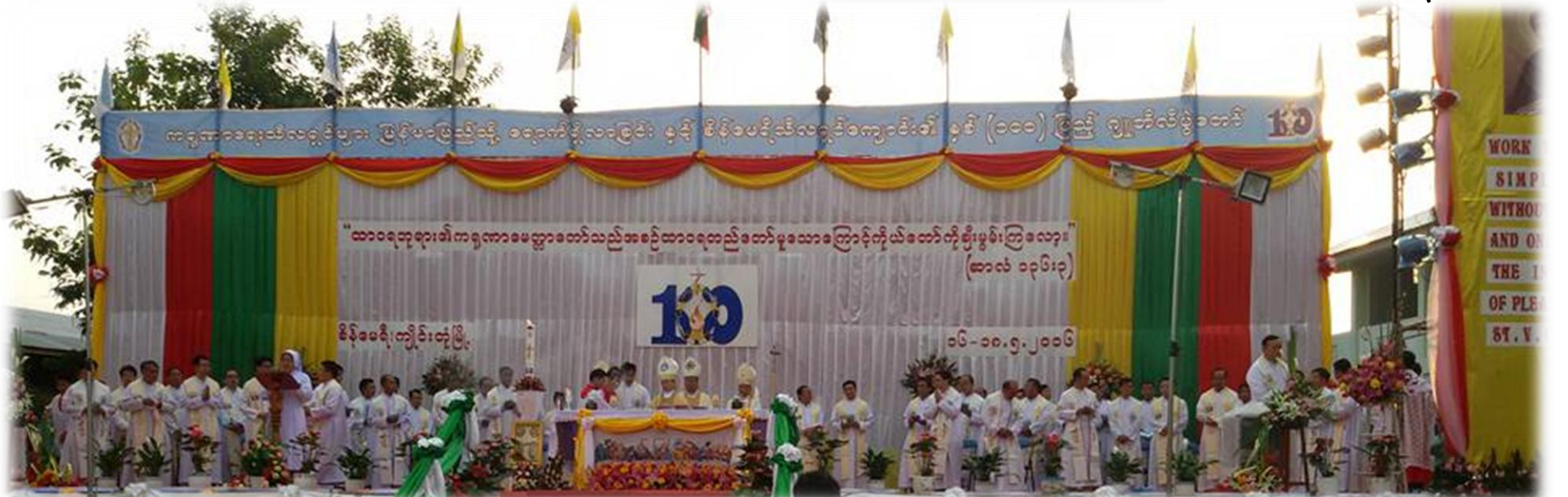
ကရုဏာရေးသီလရှင်များ မြန်မာပြည်သို့ ရောက်ရှိလာခြင်းနှင့် စိန်မေရီသီလရှင်ကျောင်းနှစ်(၁၀၀)ပြည့်... စာ(၁၃)