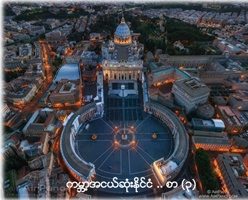
ကမ္ဘာ့အငယ်ဆုံးနိုင်ငံ .. စာ (၃)