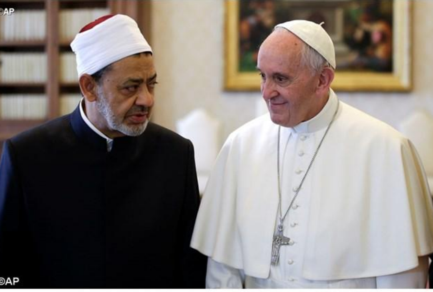
၂၂၊ ၅၊၂၀၁၆နေ့တွင် ရဟန်းမင်းကြီးဖရန်စစ်အရှင်သူမြတ်မြတ်က Grand Imam of Al-Azhar, Sheik Ahmed Muhammad Al-Tayyib ကိုခင်မင်ရင်နှီးစွာဖြင့်လက်ခံတွေ့ဆုံ

ဟူသောအမှတ်တရအတွက်လက်ခံရရှိခဲ့ပါသည်။ရည်ရွယ်ချက်မှာထိုနေ့ရက် တွင် မိသားစုတိုင်းသည် မိမိတို့၏ ကွန်ပျူတာများ၊ မိုဘိုင်းဖုန်းများနှင့် အခြား သောစက်ပစ္စည်းများကိုထားခဲ့ကာ မိမိတို့၏မိသားစုဝင်များနှင့်ချစ်ခြင်းကို ဖလှယ် သောနေ့၊ ပျော်ရွှင်သောနေ့ဖြစ်စေရန်ဖြစ်ပါသည်။