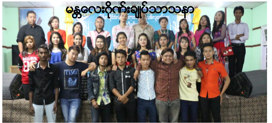
မန္တလေးဂိုဏ်းချုပ်သာသနာ