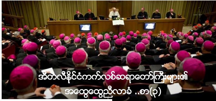
အီတလီနိုင်ငံကက်လစ်ဆရာတော်ကြီးများ၏ အထွေထွေညီလာခံ ..စာ(၃)