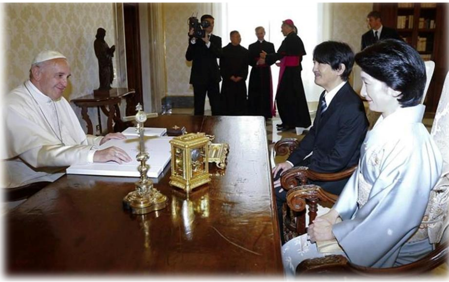
ခြေလက်အင်္ဂါအတုများကိုဖန်တီးပြုလုပ်ပေးသည့် အထက်တန်းကျောင်းသားများ