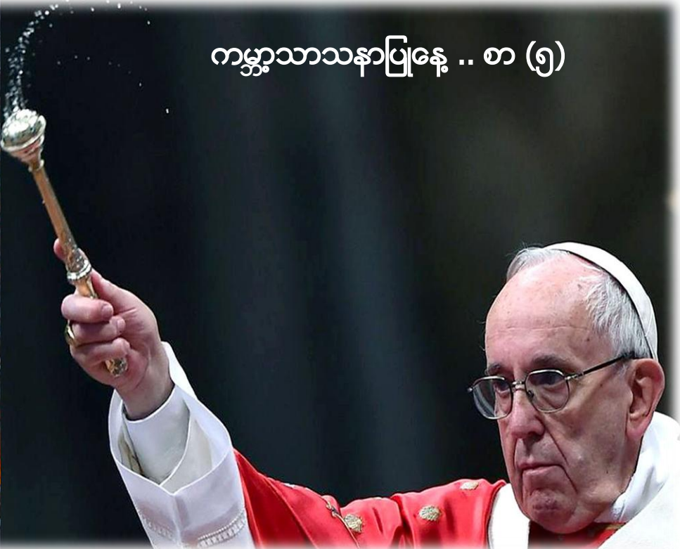
ကမ္ဘာ့သာသနာပြုနေ့ .. စာ (၅)