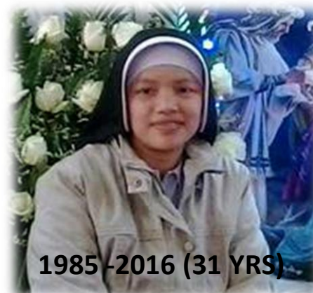
1985 -2016 (31 YRS)

၂၀၁၆ ခုနှစ်၊ မေလ (၁၂) ရက်နေ့၊ နံနက် (၂ နာရီ၊ ၃၅ မိနစ်) အချိန်တွင် အဘဘုရားရှင်၏ ထာဝရအိမ်တော် မြတ်သို့ ပြန်လည်ခေါ်ဆောင်ခြင်း ခံခဲ့ ပါသည်။ (FMM Sisters)