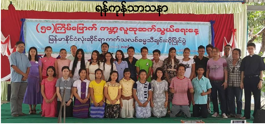
ရန်ကုန်သာသနာ