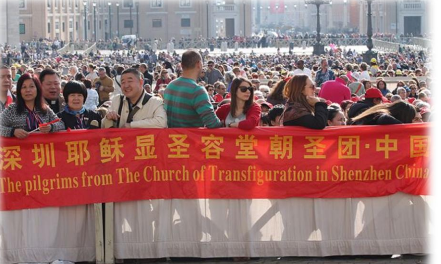
ကက်သလစ်ဆရာတော်ကြီးများဆိုင်ရာလူထုဆက်သွယ်ရေးရုံး