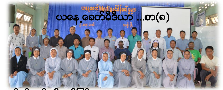
ယနေ့ခေတ်မီဒီယာ ...စာ(၈)