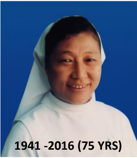
1941 -2016 (75 YRS)