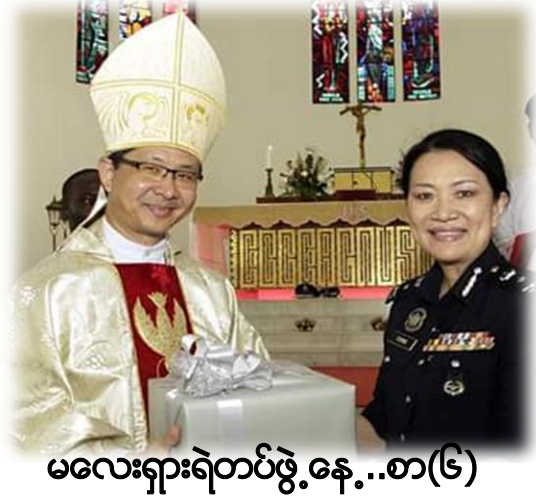
မလေးရှားရဲတပ်ဖွဲ့ နေ့..စာ(၆)