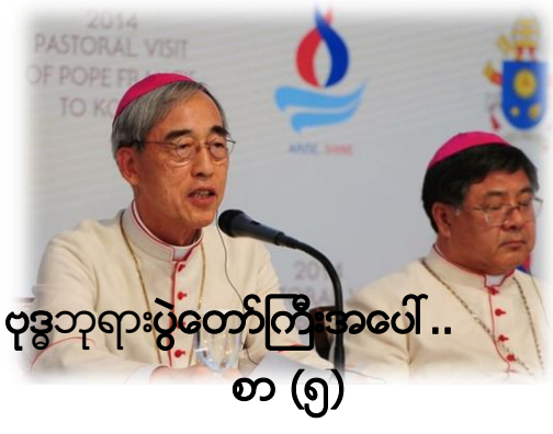
ဗုဒ္ဓဘုရားပွဲတော်ကြီးအပေါ်.. စာ (၅)