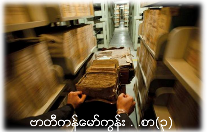
ဗာတီကန်မော်ကွန်း ..စာ(၃)