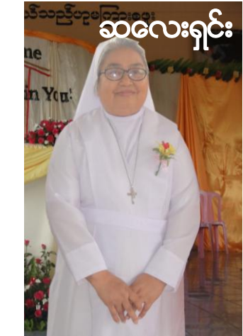
ဆလေးရှင်း