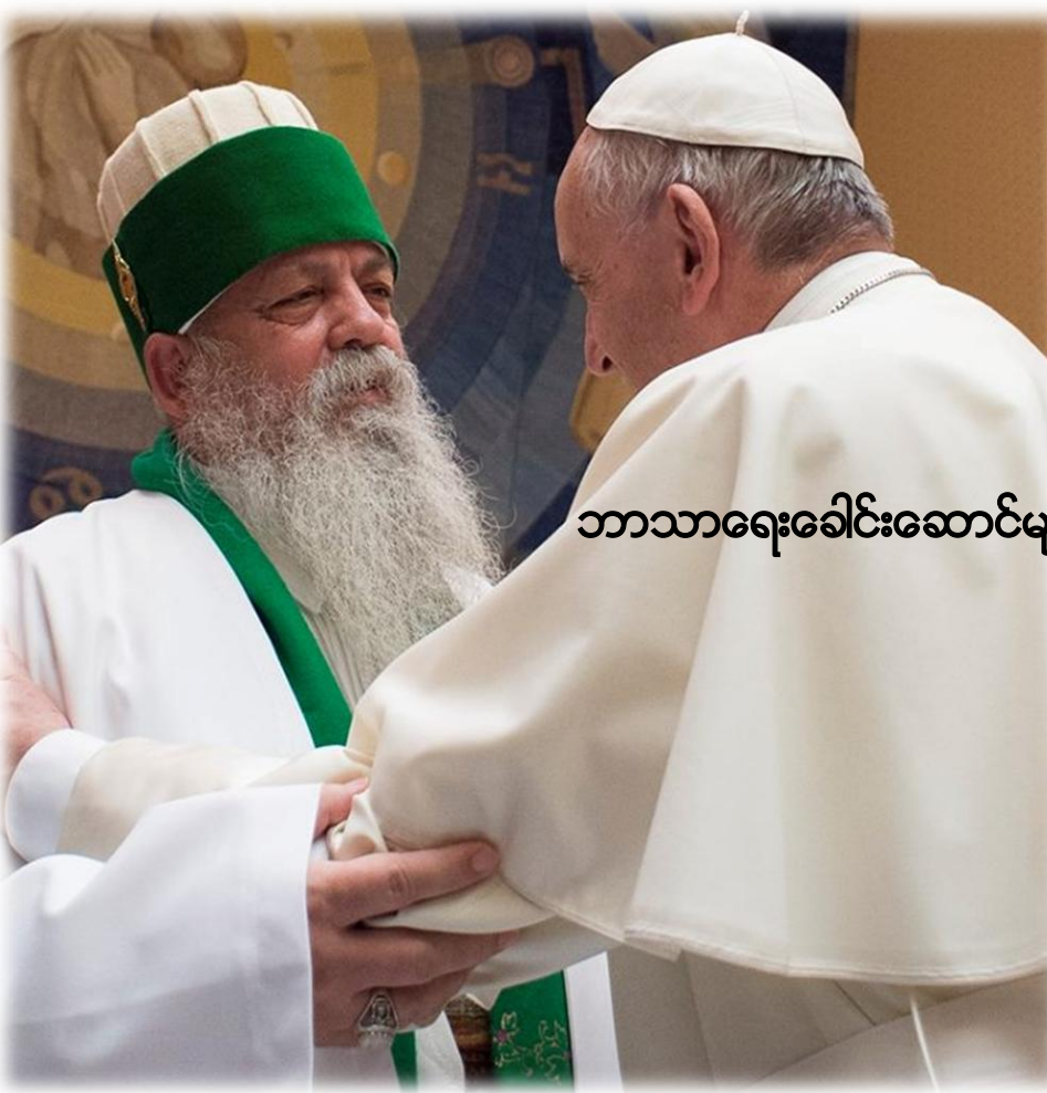
ဘာသာရေးခေါင်းဆောင်များကို လက်ခံတွေ့ဆုံ ..စာ(၆)