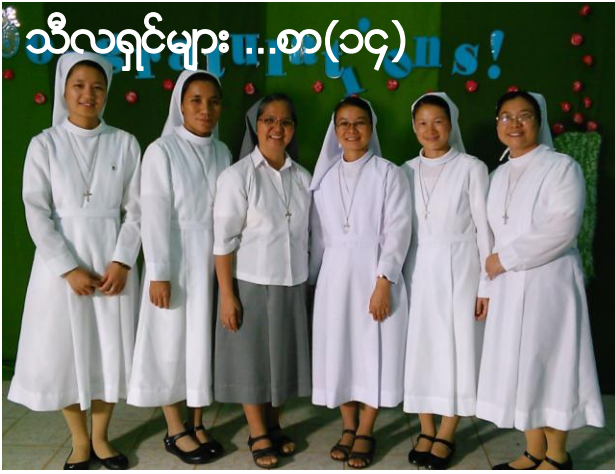
သီလရှင်များ...စာ(၁၄)