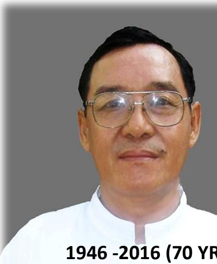
1946 -2016 (70 YRS)