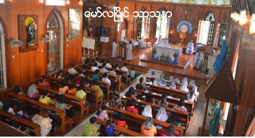
မော်လမြိုင် သာသနာ