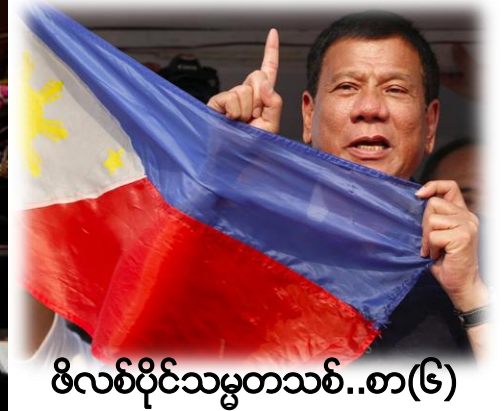
ဖိလစ်ပိုင်သမ္မတသစ်..စာ(၆)