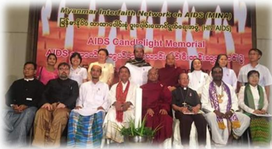
အောက်မေ့သတိရဆုတောင်းပွဲ.. စာ(၁၆)