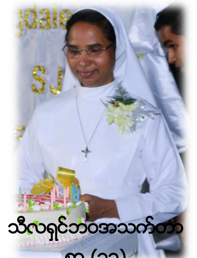
သီလရှင်ဘဝအသက်တာ စာ (၁၃)